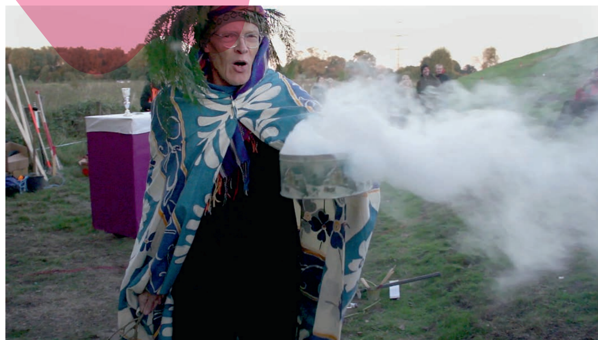
Florian Hüttner: Die große Emscher-Teufelsaustreibung von Stephan Dilleuth am 29. September 2013, Videostill, 2014

Programm ausgewählt von Katja Lell / VETO Film, Marie-Hélène Gutberlet, Florian Hüttner, u.a.